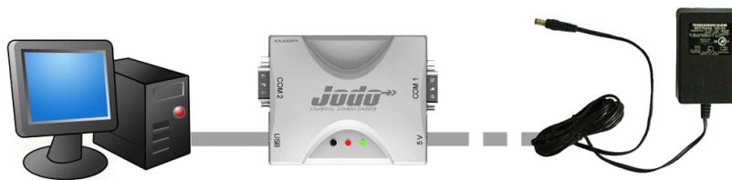
Figure 1.1 Connecting JODO and a PC