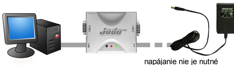
Obrázok 1.1 Zapojenie JODO a PC